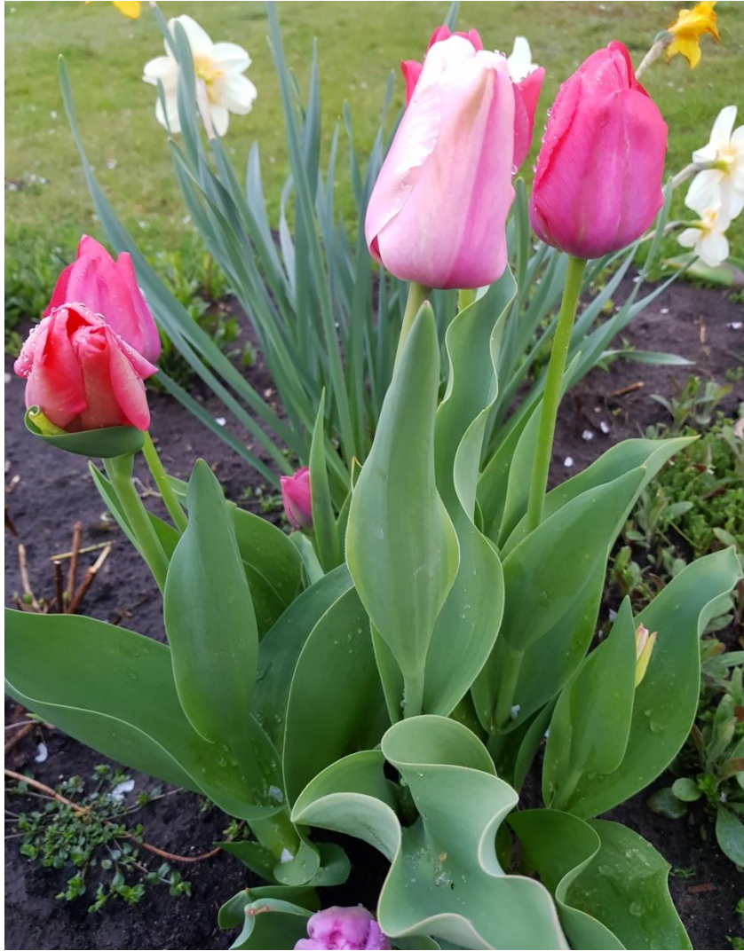
TULIPANY I ŻONKILE