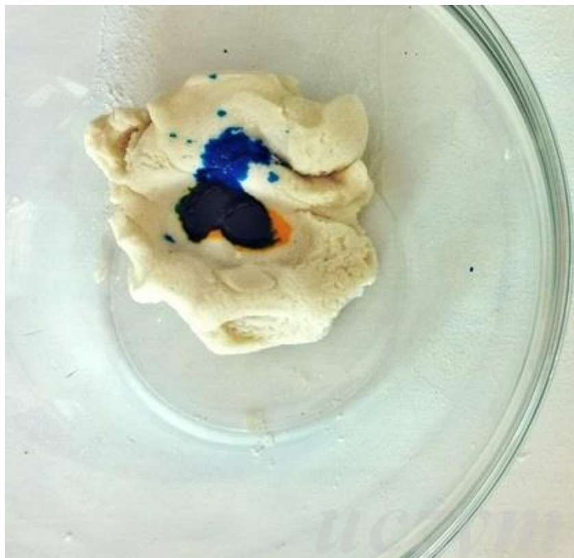
Kolorowa, wiosenna masa solna