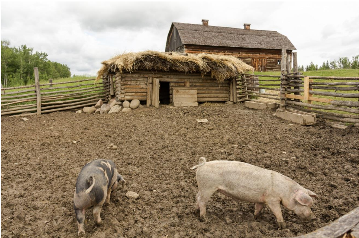
chlewik - świnka