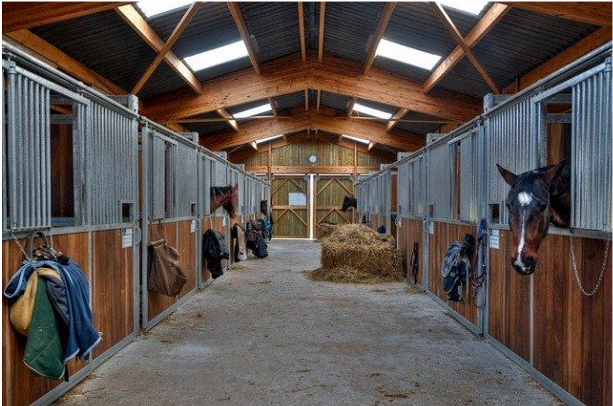
stajnia - koń