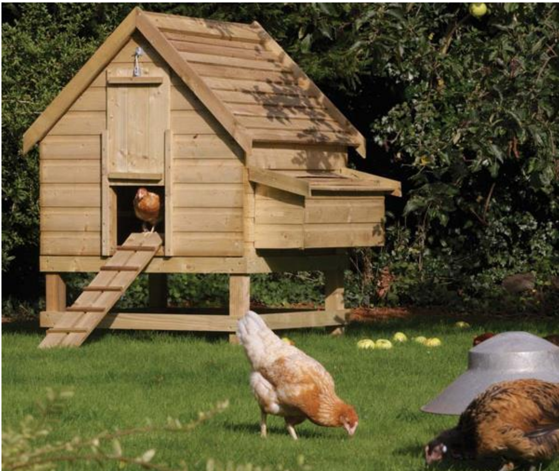
kurnik – kury i kogut