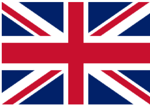
Flaga Wielkiej Brytanii