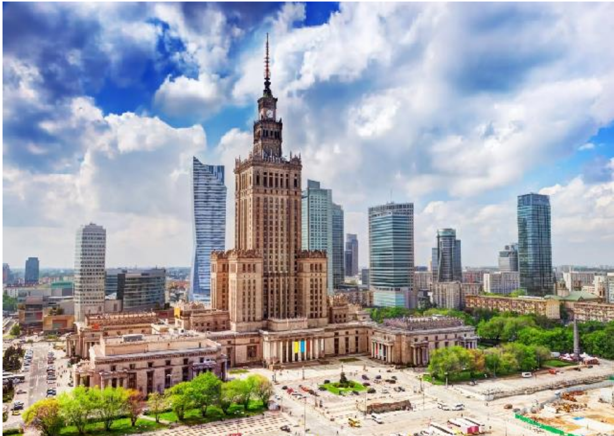
PAŁAC KULTURY I NAUKI

dywanie, podnosi do góry nogi i pedałuje. Podczas podróży dziecko porusza się różnymi środkami lokomocji, przesiada się na odpowiednich stacjach zwiedzając zabytki (pokazujemy zdjęcia danego zabytku po każdej przesiadce).