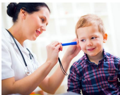
Badaj kontrolnie uszy