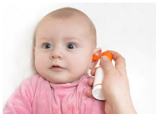
Dbaj o higienę