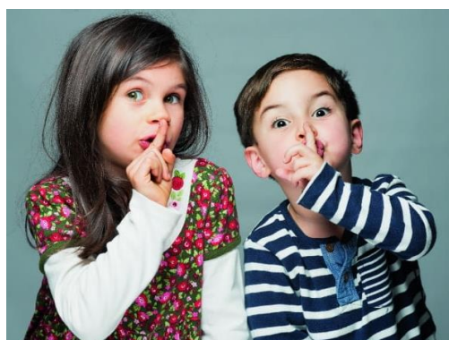
Zachowaj ciszę w otoczeniu