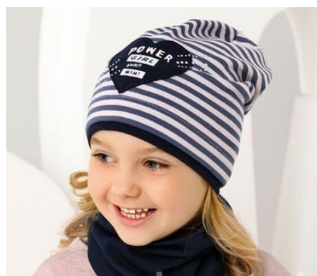
Zapewnij ciepło uszom