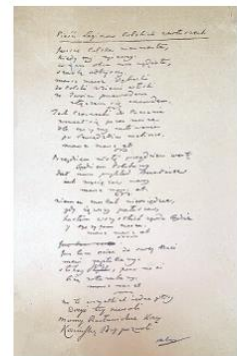
Hymn Polski „Mazurek Dąbrowskiego”

Dziękuję za uwagę. Wszystkie prawa zastrzeżone. Materiał przeznaczony wyłącznie do celów edukacyjnych.