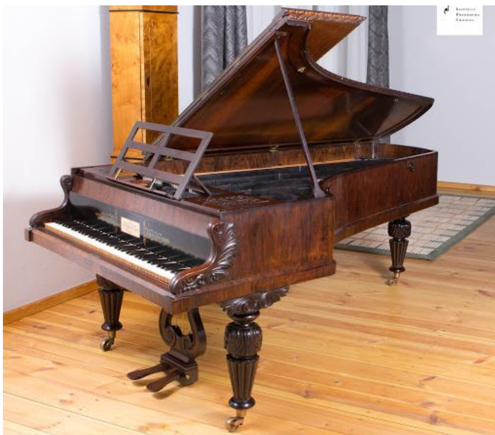
Fortepian – na którym grał i tworzył Fryderyk Chopin.