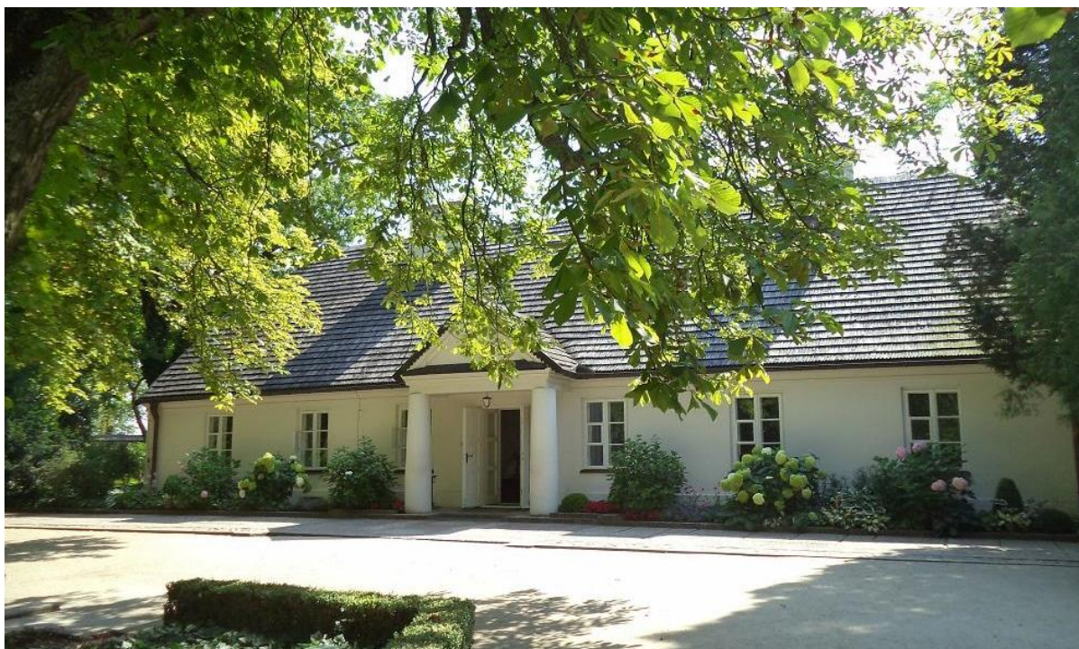
Dom urodzenia Chopina w Żelazowej Woli – obecnie oddział Muzeum Fryderyka Chopina w Warszawie.