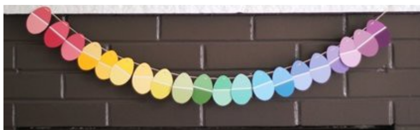
girlanda z papierowych jajek