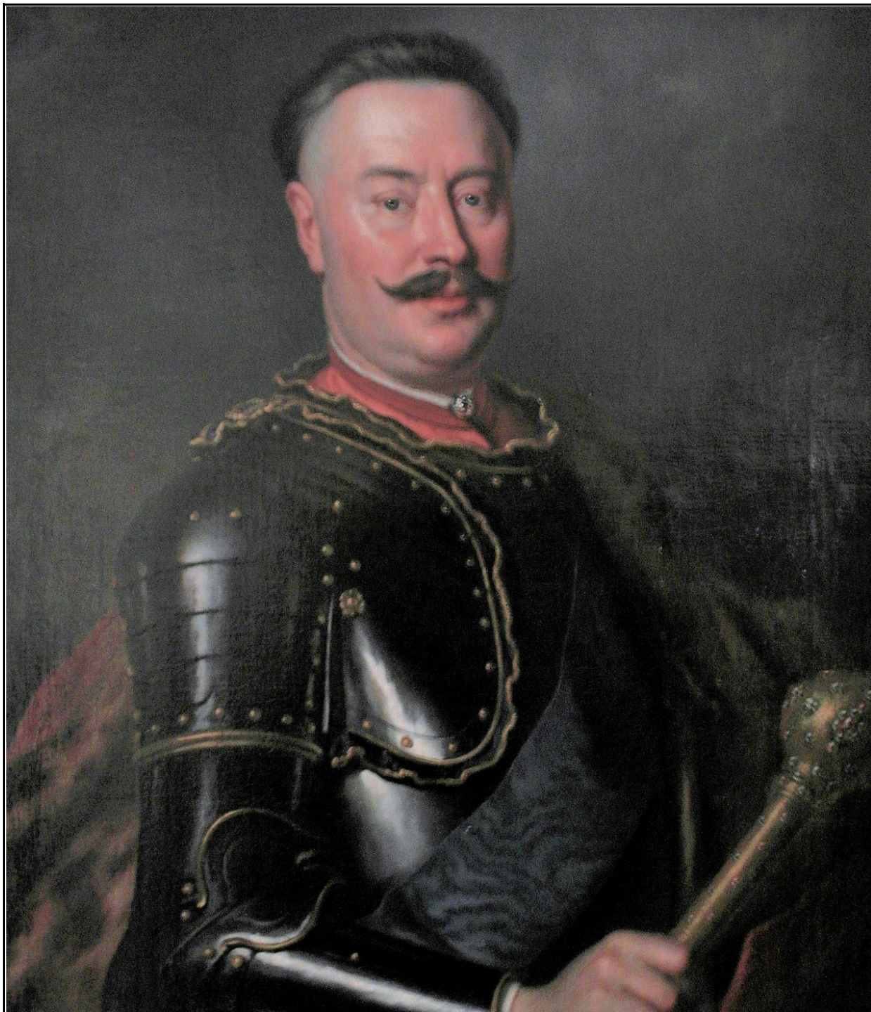
Jan Klemens Branicki (1689 – 1771)

1. Ludzie, którzy wpłynęli na rozwój naszego miasta.