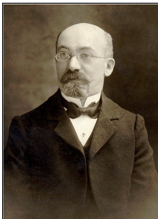
Ludwik Łazarz Zamenhof (1859-1917)

Lekarz okulista, inicjator esperanto czyli najbardziej rozpowszechnionego na świecie międzynarodowego języka pomocniczego. Jego pragnieniem było stworzenie neutralnego i łatwego do nauki języka, przydatnego do międzynarodowej komunikacji, nie zastępującego jednak innych języków narodowych. Ośmiokrotnie nominowany do Pokojowej Nagrody Nobla.