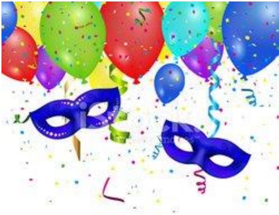
balony, maski, serpentyny, konfetti