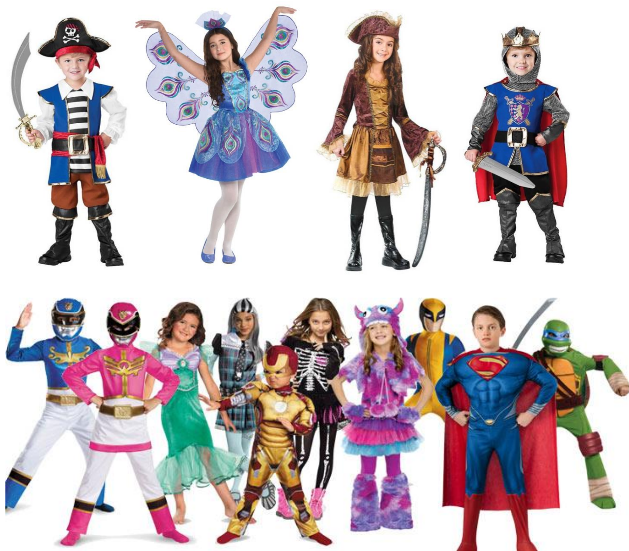
stroje karnawałowe (na zdjęciach dzieci przebrane za różne postacie)