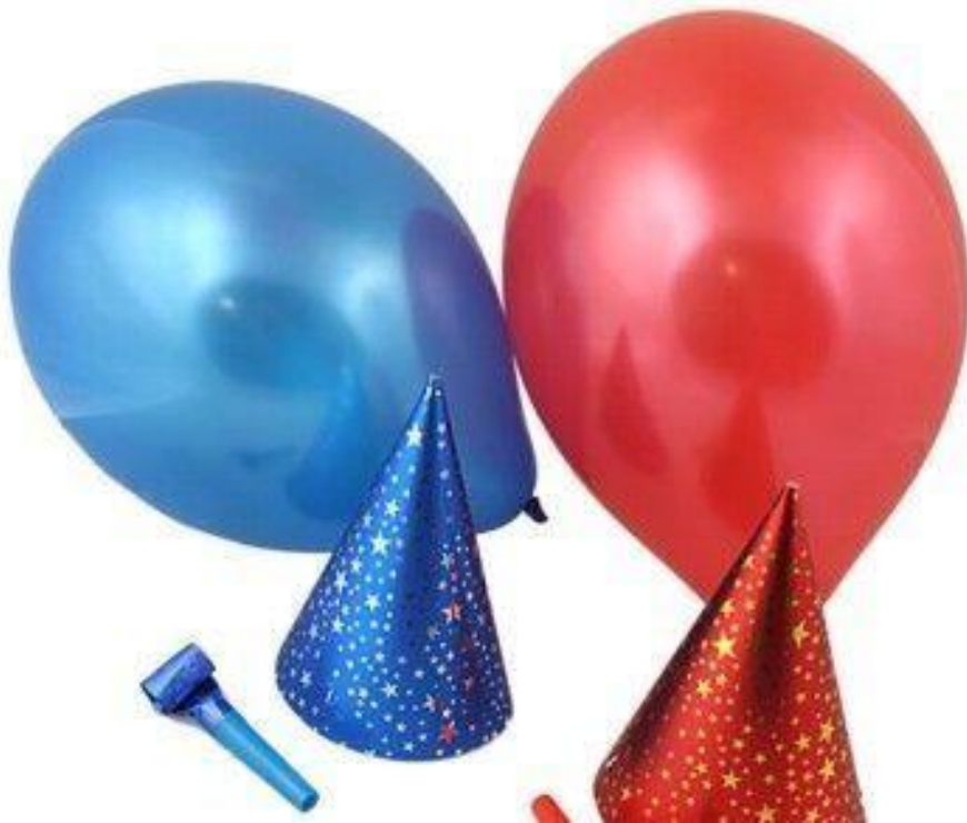
balony, czapeczki i trąbka