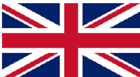
Wielka Brytania wystąpiła z UE

Unię Europejską można porównać do grupy przedszkolnej, w której jest przyjaźń, wszyscy się znają, przestrzegają określonych zasad, wspólnie podejmują decyzje, pomagają sobie. Obecnie w skład UE wchodzi 27 państw: Belgia, Francja, Holandia, Luksemburg, Niemcy, Austria, Włochy, Irlandia, Dania, Grecja, Hiszpania, Portugalia, Finlandia, Szwecja, Cypr, Czechy, Estonia, Litwa, Łotwa, Malta, Polska, Słowacja, Słowenia, Węgry, Bułgaria, Rumunia, Chorwacja. Rodzic wymienia je pokazując na mapie lub pokazuje flagi poszczególnych państw poniżej. Należy wspomnieć i pokazać wśród flag, że Wielka Brytania wystąpiła z Unii Europejskiej.